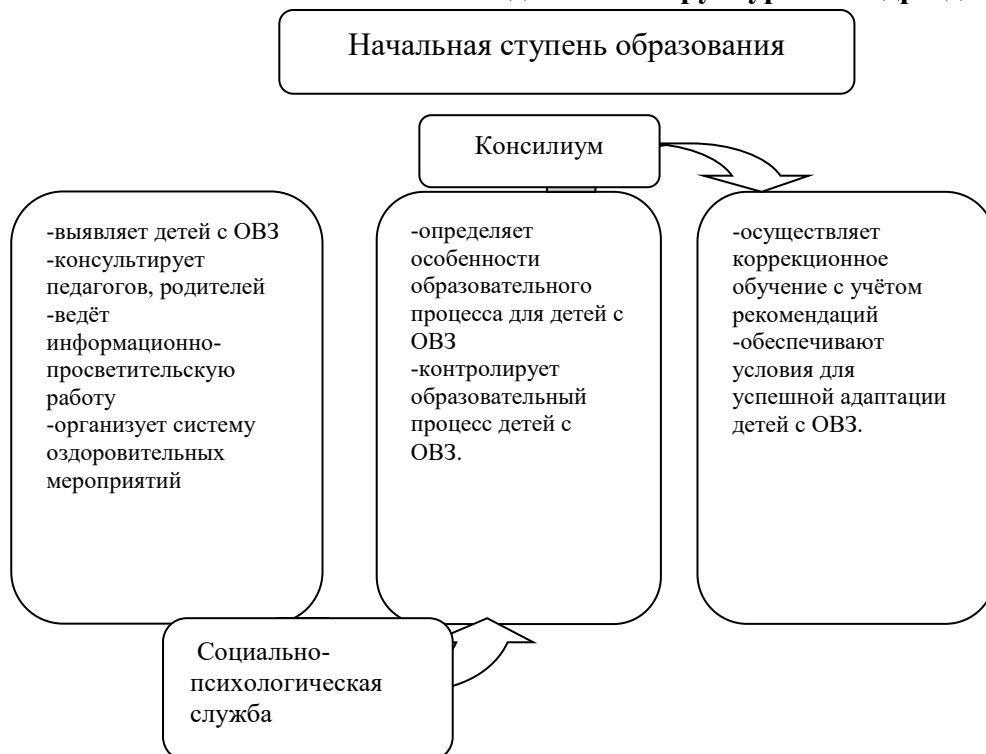
Схема. Механизм взаимодействия структурных подразделений школы