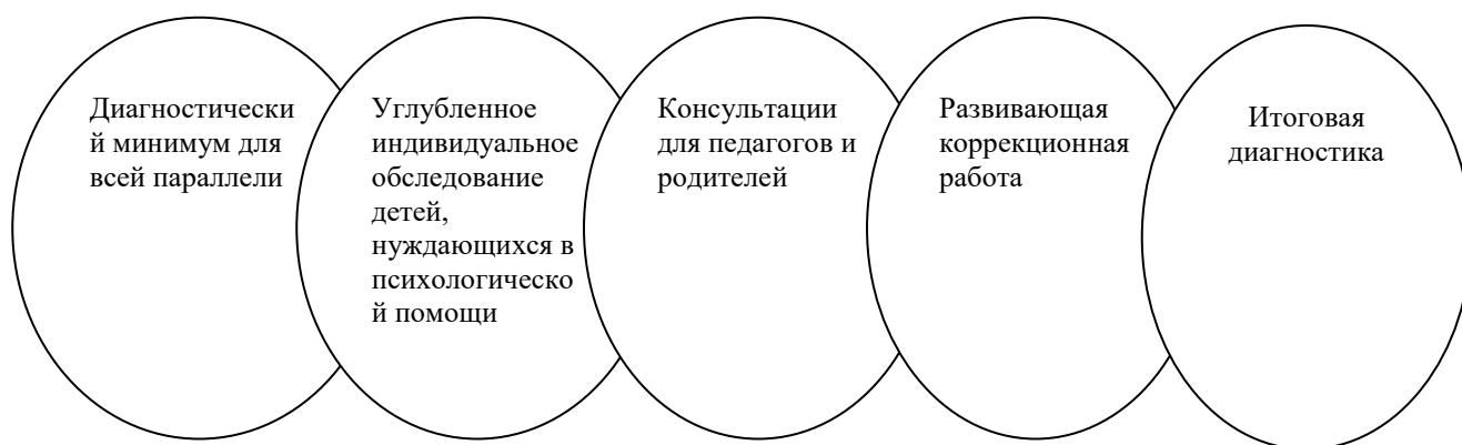
Схема. Механизм реализации программы