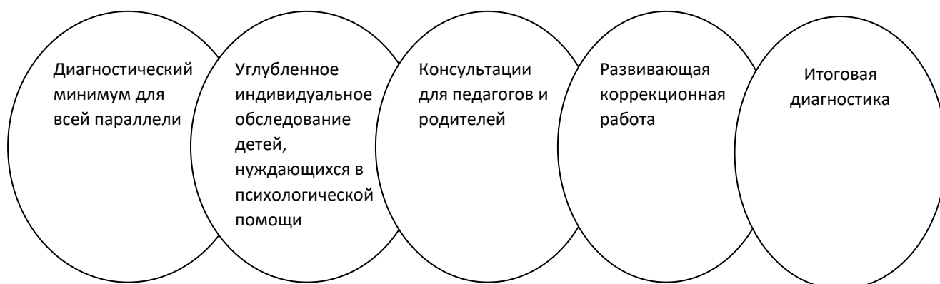
Схема. Механизм реализации программы